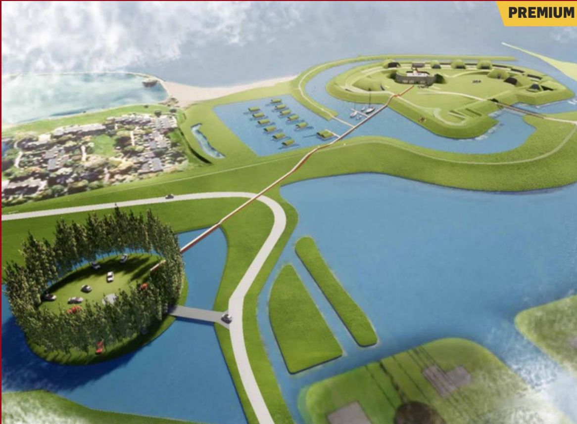
▲ Vanaf het parkeereiland kunnen bezoekers over een loopbrug naar Fort Buitensluis. © RoosRos Architecten