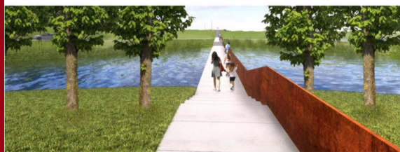
▲ De lange loopbrug naar het fort gaat dwars door de natuur van Numansdorp. © RoosRos Architecten

Want de gemeente kocht het fort onlangs voor 100.000 euro aan en besteedde de exploitatie uit aan de Stichting Fort Buitensluis. Daarnaast werd er 3,5 ton geïnvesteerd in een eerste opknopbeurt en renovatie van het verdedigingswerk, het plaatsen van een toiletgroep voor bezoekers en het verbeteren van de openbare toegankelijkheid. „Kortom, zo langzamerhand zit er al een enorm bedrag van de gemeente in het fort. Het is nu de beurt aan iemand anders“, zegt Flieringa. „Wat als de provincie niet wil meewerken? Dan zoeken we andere wegen. Want die brug komt er sowieso.“