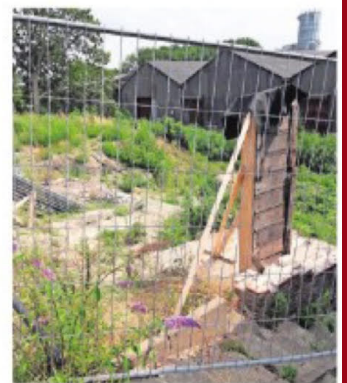
▲ In de Molendijk in Numansdorp zit een gat, nadat een schuur is afgebroken.

Volgens wethouder Bas Boelhouwers is het mogelijk om op die plek drie woningen te ontwikkelen met zes parkeerplaatsen. Om te voorkomen dat het plan nog langer voortsleept, bekijkt het college van Cromstrijen deze zomer of de ontwikkelaar en de burens alsnog met elkaar rond de tafel kunnen komen en het eens kunnen worden over een bouwplan waarmee beide par-