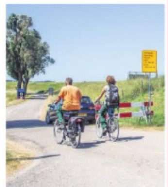
Fietsers rijden de officieel afgesloten Spuiweg in.

De gemeenteraad draagt ook oplossingen aan, zoals de aanleg van een tijdelijke weg over het land naar de turbines, een fietspad op de dijk of het transport van windmolenonderdelen over het water.