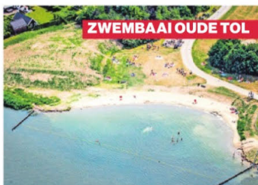
ZWEMBAAI OUDE TOL

▲ Ondanks de droogte is er nog voldoende water in de natuurspeeltuin op Tiengemeten om met vloten te varen.