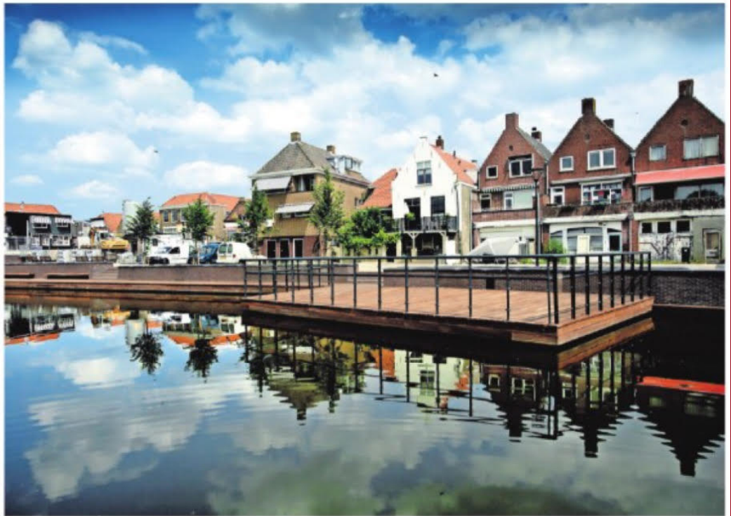
▲ De Kaai ziet er bijna weer spic en span uit. Maar de nieuwe ‘huiskamer van Strijen’ zorgt er wel voor dat de monumentencommissie in de gemeente er de brui aan geeft.

Daarnaast is het een feit dat de gemeente nooit de archeologische Beleidsadvieskaart voor Strijen