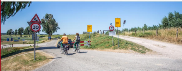
▲ Fietsers negeren de afgesloten Spuiweg.