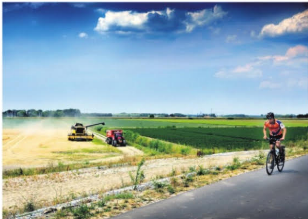
▲ De Leenheerenpolder gaat vanaf volgend jaar op de schop.

De wethouder hoopt nog dit jaar op goedkeuring van de gemeenteraad voor het nieuwe bestemmingsplan. „Dit plan is goed voor Goudswaard en Korendijk. Winkels en verenigingen profiteren ervan”, zegt Boogaard. „De recreatiewoningen en de plas trekken recreanten aan. Dat biedt kansen voor de horeca en winkels. Daarnaast ontstaat er een uniek natuurgebied.”