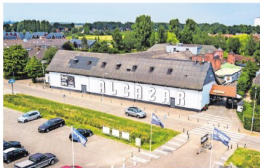
▲ De voormalige discotheek trok in het verleden elk weekeinde duizenden jongeren.

Tot wanneer Alcazar open blijft, is nog niet duidelijk.