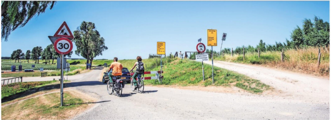
▲ De Spuiweg is vanwege het transport voor de te bouwen windmolens verboden terrein voor fietsers, maar velen trekken zich er weinig van aan.