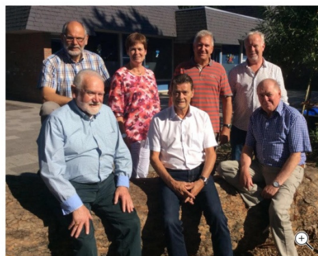
DE KANDIDATEN VAN DE SENIOREN PARTIJ.

De Hoeksche Waardse Senioren Partij doet op 21 november definitief mee aan de gemeenteraadsverkiezingen. De eerste nieuwe lokale partij had daarvoor al langer plannen, maar liet dat nog wel afhangen van de vraag of er voldoende kandidaten met kwaliteit, ervaring en enthousiasme konden worden binnengehaald. Volgens de partij is dat ruimschoots gelukt.