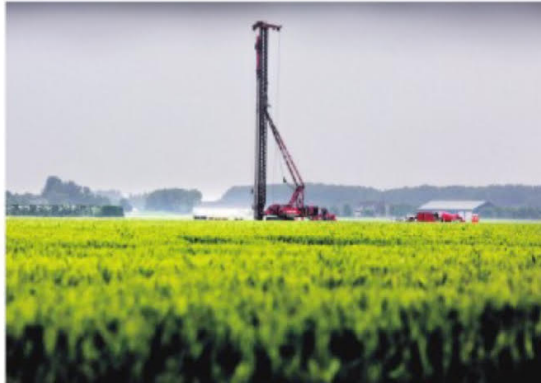
▲ De windmolens komen op 500 meter van woningen in Nieuw-Beijerland te staan.

Bovendien is de provincie, die het 'bevoegd gezag' is voor het windmolenpark, niet van plan eraan mee te werken. Wel wil de gemeente cijfers verzamelen voordat de vijf windmolens van ruim 200 meter hoog volgend jaar gaan draaien. Omwonenden van de toekomstige turbines drongen daar maandagavond tijdens een bijeenkomst met de Omgevingsdienst Zuid-Holland Zuid en de gezondheidsdienst ook al op aan.