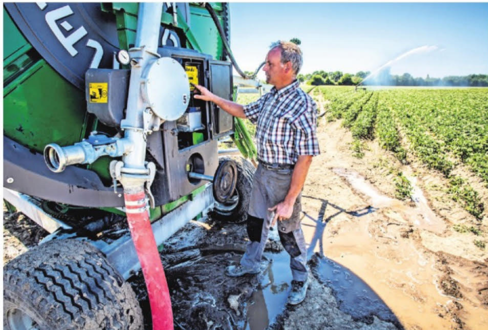
▲ De akkers in de Hoeksche Waard worden besproeid om de oogst niet in de soep te laten lopen.

Wel is 'Schieland' sinds een week bezig met het creëren van een waterbuffer door water vanuit rivieren 'binnen te laten'. Zo'n buffer is de voorbereiding op het moment dat er geen water meer uit de rivieren mag wor-