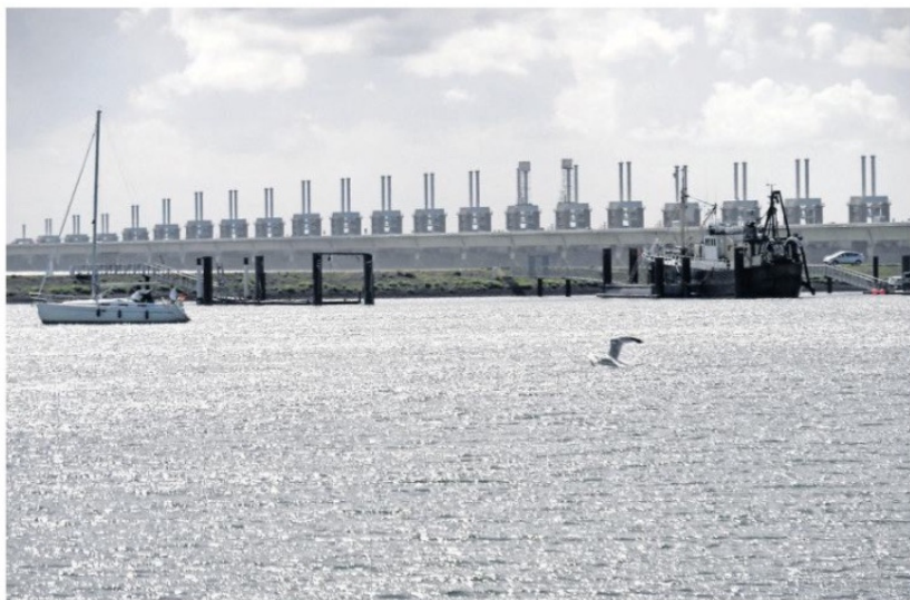
Door oorzaken als watervervuiling en riviercompartimentering waren, op palingen na, vele vissoorten al ver voor de sluiting van het Haringvliet uit onze rivieren verdwenen.

lijk niets zijn veranderd, althans boven water. Dat was bij de sluiting van het Haringvliet bijna een halve eeuw geleden anders. Die gebeurtenis was een milieuschok van jewelste waarvan de effecten direct, hevig en voor ieder zichtbaar toesloegen. Het tijverschil viel terug van 2 tot 30 centimeter. De brede voedselrijke slikken langs de oevers en in estuarium waren direct en voorgoed foetie en daarmee ook de vogelsoorten die voor hun voedselvoorziening van die slikken afhankelijk waren: wintertalingen en steltlopers. Voorts verzoette het milieu. Een paar dagen na die sluiting trof ik tijdens een voettocht langs de buitenzijde van de Korendijk-sche Slikken een opmerkelijke hoeveelheid jonge dode zeevis aan. Bij die wandeling stelde ik voorts vast dat er een enorme oeverafslag op gang gekomen was, gevolg van het wegvallen van het tij waardoor het water nog maar op één niveau tegen onbeschermde oevers sloeg. Pas in 2000 werd met het aanbren-gen van de laatste oeververdediging op de Hoogezand-sche Gorzen dat proces tot