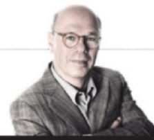
MAX PAM BEWERINGEN & BEWIJZEN