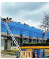
▲ Het project in Puttershoek.