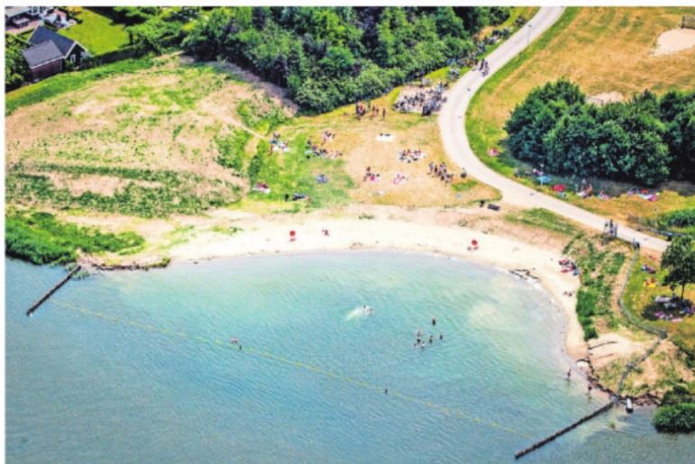
▲ De Oude Tol werd vorig jaar uitgegraven tot een zwembad.

Vorige week is onderzocht of of er bommen liggen op de plek van de baggerwerkzaamheden. „Er is nog geen terugkoppeling geweest”, aldus Van Tilborg.