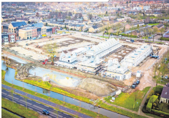
■ De burens van Rembrandt komen er aan. De woonwijk Meesterlijk Wonen aan de rand van Oud-Beijerland gaat qua uitstraling veel lijken op het naastgelegen woonzorgcentrum. De funderingen van de meeste woningen liggen er al enige tijd, maar sinds kort staan ook de daken van de woningen fier overeind. De wijk moet nog dit jaar worden opgeleverd.