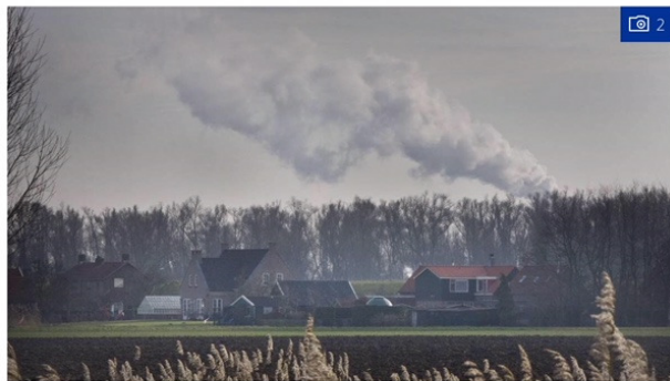
De Hoeksche Waard is diep verdeeld over het voorgenomen besluit om de vijf gemeenten te laten fuseren tot één gemeente.