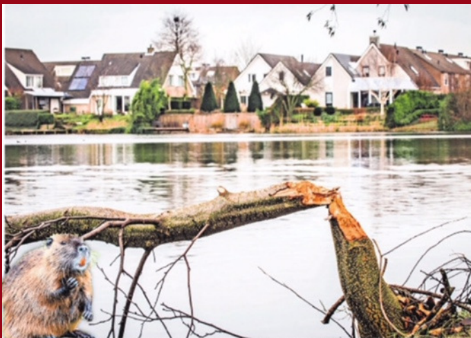
▲ De plas water bij de Oude Tol in Oud-Beijerland is ideaal terrein voor bevers.

Hij hoopt dat zijn vlag wordt gebruikt bij evenementen en manifestaties waar de Hoeksche Waard zich als regio presenteert. Bijvoorbeeld bij congressen of landbouwmanifestaties. Het Samenwerkingsorgaan Hoeksche Waard (SOHW) heeft al een vlag. Maar: „Steeds meer organisaties en bedrijven printen hun logo op een vlag”, zegt hij. „Voor de promotie van een product is dat prima, maar als vlag stellen ze niet meer voor dan wapperend briefpapier.”