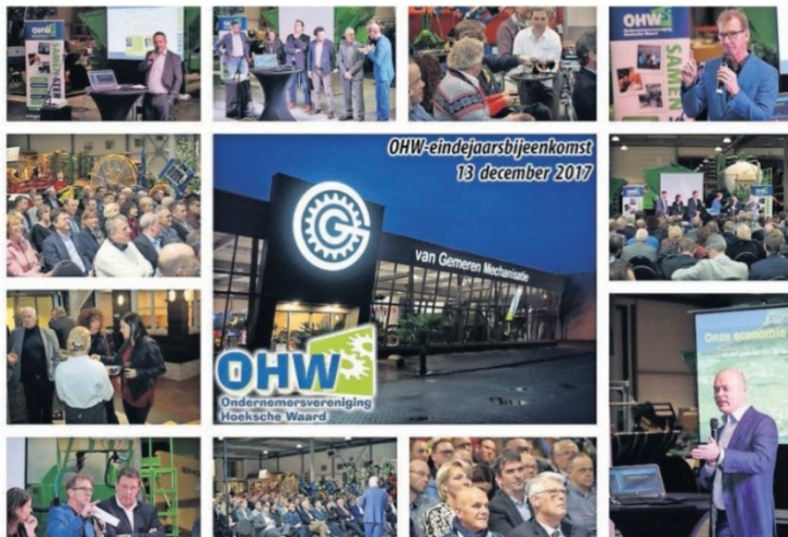
Tijdens de geanimeerde eindejaarsbijeenkomst van de OHW werd er terug geblikt en nagedacht over de toekomst.

om meer loon, straks wordt hen gesmeekt om te komen werken,” voorzag Bouman.