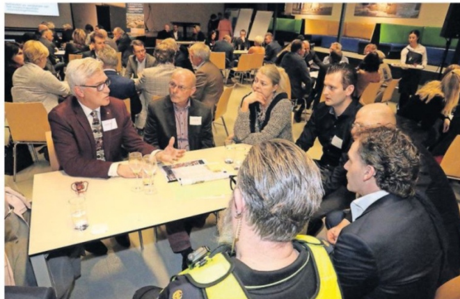
Levendige discussies met deskundigen op allerlei gebied aan tafel, over de vraag welke rol Oud-Beijerland heeft in de mogelijke fusiegemeente Hoeksche Waard.

het maken, aan de slag dus.’ De boodschap annex uitnodiging moet in de Hoeksche Waard geland zijn, want onder haar gehoor in de scholengemeenschap Willem van Oranje zaten de burgemeesters van Cromstrijen, Korendijk en Strijen. Het Spuidorp kent tal van