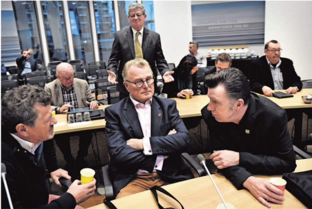
Leden van de Drecht- raad vergaderen begin november in het ge- meentehuis van Papen- drecht.