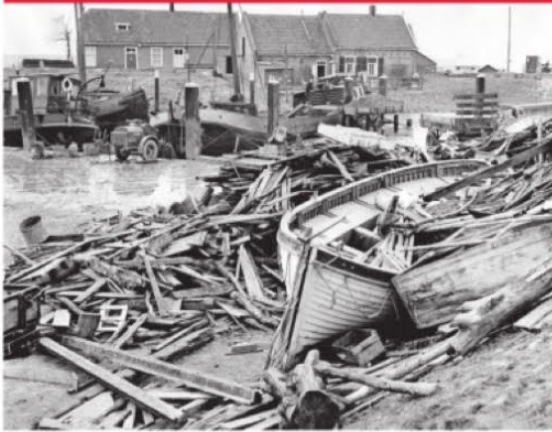
◀ De watersnoodramp legde de haven van Numansdorp volledig in puin.