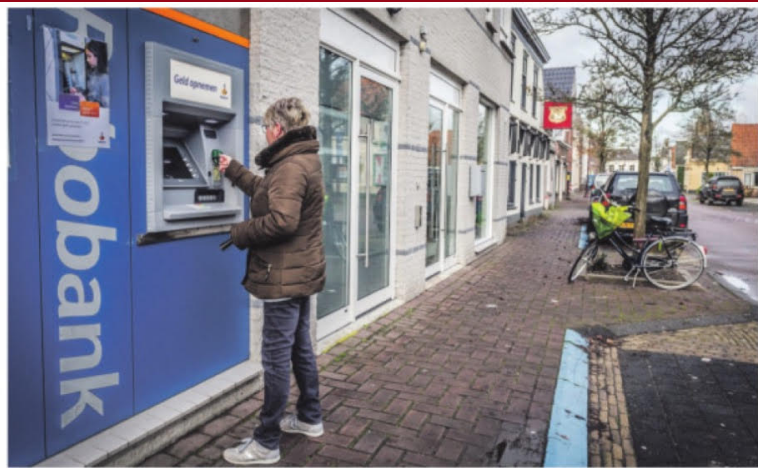
▲ De geldautomaat aan de Voorstraat in Klaaswaal verdwijnt. Pinnen kan nog wel in de Plus.