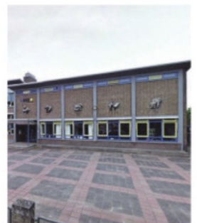
▲ Het huidige pand van het Actief College.

Voor leerlingen van basisschool De Ark volgt een periode met veel veranderingen. Zij moeten op korte termijn hun huidige schoolgebouw verlaten en verkassen naar een tijdelijk onderkomen in de Margrietstraat. Daar moeten nog wel asbestplaten worden verwijderd alvorens het gebouw beschikbaar is.