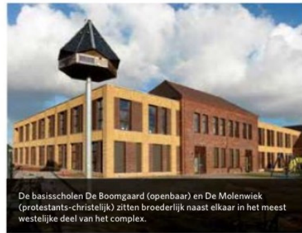
De basisscholen De Boomgaard (openbaar) en De Molenwiek (protestants-christelijk) zitten broederlijk naast elkaar in het meest westelijke deel van het complex.

Exclusief HOEKSCHE WAARD 9e jaargang nr. 101 | 21 - 24 november 2017 | 72 pagina's