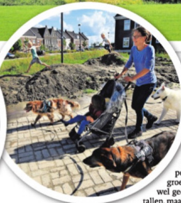
▲ Goeree-Overflakkee heeft meerdere pittoreske dorpjes. Inmiddels zijn er ook verschillende nieuwbouwprojecten, om jonge gezinnen te trekken.

moet je het niet hebben als je een gezonde, aantrekkelijke gemeente wilt blijven, weten ze. „Dat toerisme komt wel. Maar we willen ook een gezonde balans tussen jong en oud en tussen recreatie en permanent gevestigde inwoners.”