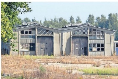
De mechanische werkplaatsloodsen werden door deskundigen als 'zeldzaam' gekwalificeerd

PUTTERSCHOEK - De gemeente heeft de schoorsteen en de mechanische werkplaats als tastbaar aandenken aan het verleden aangewezen als gemeentelijk monument. De Suiker Unie had haar twijfels over dat plan maar nu de rimpels tussen gemeente en Suiker Unie glad zijn gestreken is het de vraag of de loodsen en schoorsteen blijven staan. Ze staan (nog?) niet ingetekend in de nieuwe studies. Hoe denken buurtbewoners en historische organisaties daarover? Zijn er mogelijk mensen die op de barricaden gaan om de schoorsteen alsnog te behouden? Enkele buurtbewoners blijken nog wel hoop te hebben voor de loodsen. "Wij wonen hier achter, in de wijk achter de Arend van Lierstraat en fietsen er vaak langs. Hoog tijd dat er wat beweging in komt. Misschien kunnen ze wat doen met die loodsen, bijvoorbeeld een verzamelgebouw voor startende onder-