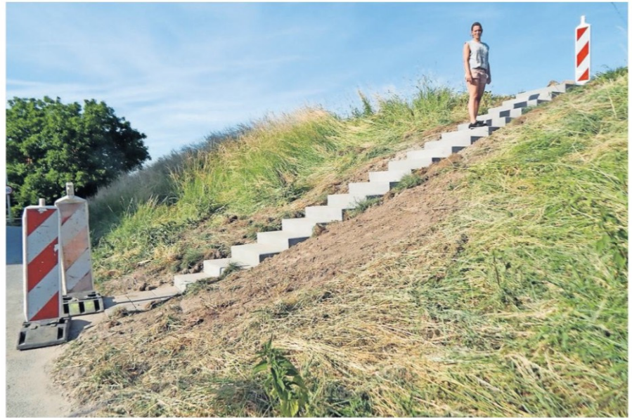
De trappen op de Kildijk zijn weer veilig voor kleine kinderen en senioren. Deze jongedame op de foto valt uiteraard buiten deze doelgroepen, maar was zo bereidwillig even voor de foto te poseren.

trappen, dus men is blij dat het nu eindelijk geregeld is. 'Het was voor ouderen gewoon een gevaarlijke trap geworden. Bij 't Schenkeltje was bijna de helft van de treden scheef gezakt of afgebrokkeld. Dat is op zich niet zo vreemd, want volgens mij zaten die trappen er vanaf mijn jeugd in