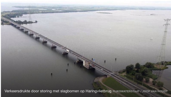
Verkeersdrukte door storing met slagbomen op Haringvlietbrug

Automobilisten hebben op de A29 bij de Haringvlietbrug op eigen houtje een kapotte slagboom weggehaald om weer verder te kunnen rijden. Na anderhalf uur was het geduld van de bestuurders op.