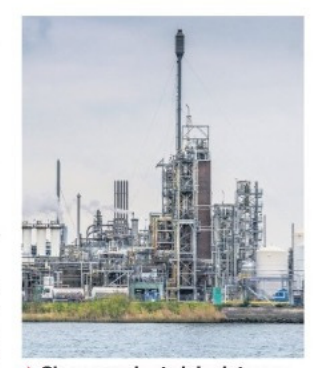
▲ Chemours legt zich niet neer bij de aanscherping van de vergunning door de provincie.

De gemeente Dordrecht zegt verbolgen te zijn over het aanvullende beroep van de Dordtse fabriek. Volgens de gemeente doet het bedrijf aan mooie woorden en niet aan daden. Begin juni stelde Chemours nog dat het de lozingen GenX wil terugdringen conform de wensen