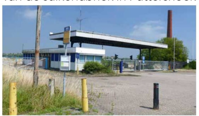
Het desolate, buitendijkse terrein, waarop eens de fiere Suikerfabriek Puttershoek stond

Het is niet het fraaiste deel van het dorp, als je over de Rustenburgstraat vanuit het westen Puttershoek binnen rijdt. Want dan kom je immers langs de plek waar vroeger de suikerfabriek van de Suiker Unie stond. De restanten van die na de campagne in 2004 gesloten fabriek staan binnendijks: zes grote opslagsilo's en het inmiddels bijgebouwde gigantische distributiecentrum die samen worden aangeduid als de Specialiteitenfabriek van de Suiker Unie. Maar buitendijks, aan de Oude Maas, ligt al jaren een groot, desolaat terrein, met de voormalige fabriekshaven. Op dat terrein prijken nog de 55 meter hoge fabrieksschoorsteen en de voormalige mechanische werkplaats, ooit - tegen de zin van de Suiker Unie in - aangewezen als gemeentelijk monument. En achter de Rustenburgstraat liggen - verscholen achter bomen, dijken en groen - de voormalige bezinkvelden, een terrein van 55 hectare.