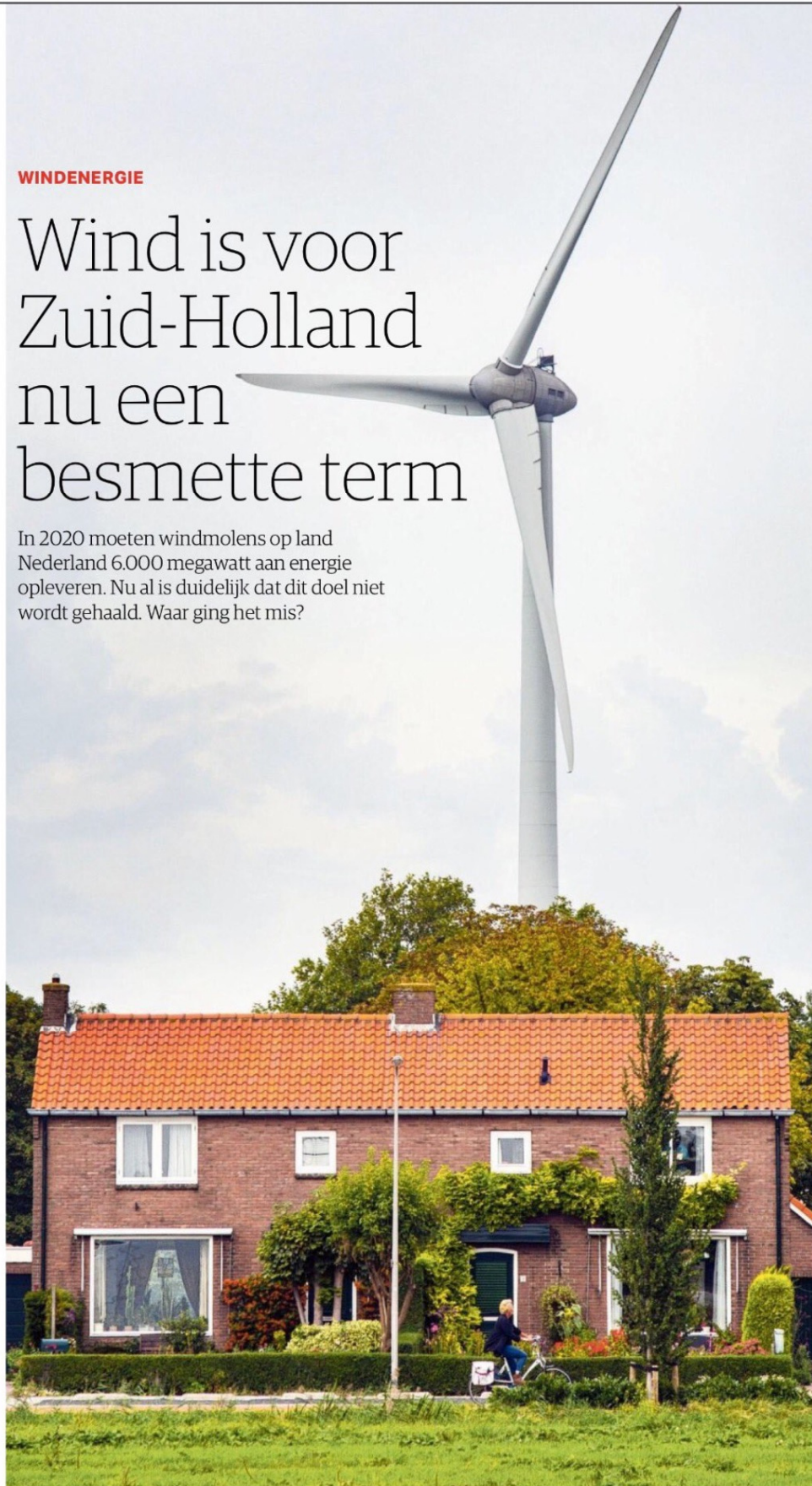
Rotterdam plaatste windmolens in het Botlekgebied, vlak bij het dorp Geervliet in de gemeente Nissewaard.

In 2020 moeten windmolens op land Nederland 6.000 megawatt aan energie opleveren. Nu al is duidelijk dat dit doel niet wordt gehaald. Waar ging het mis?