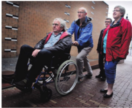
▲ De adviesgroep trok er in juni opuit.

Van Waveren kreeg de conclusies uitgereikt van de adviesgroep samenleving in het dorp. De groep, die gevraagd en ongevraagd zijn mening geeft aan de gemeente, deed dit onderzoek op verzoek van de Oud-Beijerlandse wethouder. „Hij wilde weten hoe het voor