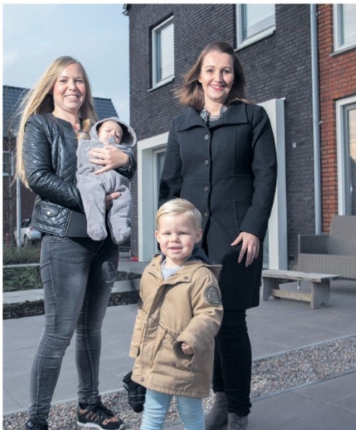
▲ Duizenden woningen moeten jonge gezinnen naar de Hoeksche Waard trekken

Grijs, grijzer, grijst. De Hoeksche Waard vergrijsd en dat baart zorgen. Maar nu duizenden jonge gezinnen moeite hebben een woning in Rotterdam te kopen, wordt de Hoeksche Waard ineens een stuk aantrekkelijker. De huizenprijzen liggen fors lager en de ruimte is aanzienlijk groter.