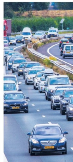
▲ De A29 drijft automobilisten soms tot wanhoop.