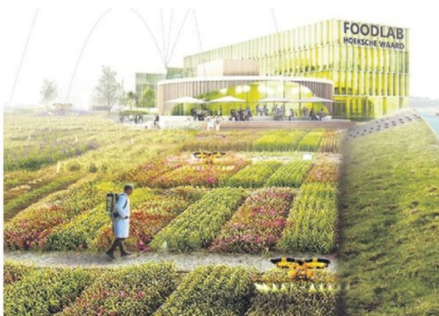
▲ Boeren kunnen hun ei kwijt in een allesomvattend Foodlab. ILLUSTRATIE STUDIO MARCO VERMEULEN

Bussen vol toeristen uit Japan, Korea, Amerika, of gewoon uit België. De komst van een Foodlab, een kenniscentrum op het gebied van landbouw en voeding, zou in meerdere opzichten spectaculair zijn. Het Foodlab kan het eiland internationaal op de kaart zetten, toeristen én scholieren trekken en zorgen voor veel werkgelegenheid in de Hoeksche Waard. Na de zomer wordt er verder gepraat over de haalbaarheid van het ambitieuze plan. Maar