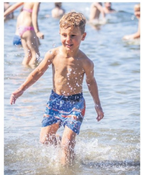
▲ Zwemmen, fietsen, wandelen: recreëren moet top zijn.

kanoroutes, struinpaden, waterbus- en pontverbindingen en nieuwe fietspaden. De belangrijke toeristische plekken moeten door één aansluitend netwerk verbonden zijn. Fort Buitensluit bij Numansdorp staat hoog op de prioriteitenlijst. Cromstrijen wil het fort kopen en er een toeristische trekpleister van maken. Daarnaast moet de ontwikkeling van de Leenheerenpolder bij Goudswaard zorgen voor tientallen hectares ongerepte nieuwe, natte natuur.