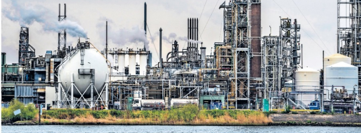
▲ De installaties van het omstreden chemische bedrijf Chemours in Dordrecht.

Chemiebedrijf Chemours ligt aan de ketting. Maar daarmee is het probleem niet opgelost, zeggen deskundigen: de chemische sector stoot nog veel meer riskante stoffen in het milieu. 'Het is een treurige situatie.'