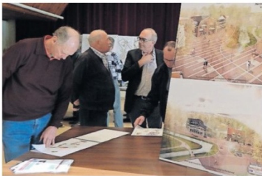
De informatieavond over het nieuwe centrumplan voor 's-Gravendeel werd 13 april druk bezocht. (Tekst en foto: Arie Pieters).

'S-GRAVENDEEL - Extra parkeerplaatsen, nieuwbouw op de locatie van het, door brand verwoeste, café De Herberg, meer winkelruimte en dit alles met behoud van het groen in het gebied. Kort samengevat zijn dat de belangrijkste zaken die werden gepresenteerd voor het nieuwe centrum van 's-Gravendeel. De klankbordgroep ging met deze plannen unaniem akkoord. Tijdens de informatieavond konden belangstellenden presentatiestudies bekijken en vragen stellen aan vertegenwoordigers van de gemeente. Onder meer burgemeester Borgdorff en wethouder Van Etten waren aanwezig. Over het algemeen waren de reacties positief. Sommigen hadden nog wel vraagtekens bij het aantal parkeerplaatsen en anderen hadden twijfels bij het verplaatsen van de bushalte van Connexion naar de Hendrik Hamerstraat. Een slordige vijftig meter verwijderd van de huidige locatie pal voor Dienstencentrum 't Weegje. "Ik hoop dat het aantal nieuwe parkeerplaatsen voldoende is, maar verder mogen ze van mij morgen beginnen. Het ziet er goed uit en na de brand in 'De