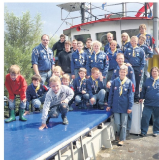
Scouting Suanabake in Nieuwendijk is een van de deelnemende verenigingen.

Het concept, waarbij sportverenigingen een aantal gratis proeflessen of trainingen aanbieden, is in Brabant een groot succes. In de Hoeksche