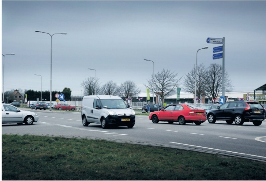
▲ Op de kruising voor Intratuin doen zich geregeld ongelukken voor.