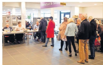
Drukte bij de stembureaus woensdag, zoals hier in 's-Gravendeel. In Binnenmaas kon men de burgerpeiling invullen.

te vroeg juichen, waarschuwen anderen: het Oekraïne referendum was ook duidelijk. Het is de vraag wat de Tweede Kamer met de uitslag zal doen. Jelle Stelpstra denkt dat die vooral naar de gevolgdere procedure zal kijken en of dat correct verlopen is. ‘Natuurlijk wordt ook naar de peiling gekeken, maar ook in de Tweede Kamer zal al snel de vraag naar het alternatief op tafel komen. Er zijn veel raadsleden voor een herindeling. Ik denk dat de kamer dat als enige alternatief zal zien.’ De gemeenteraden van Binnenmaas, Cromstrijen en Korendijk buigen zich volgende