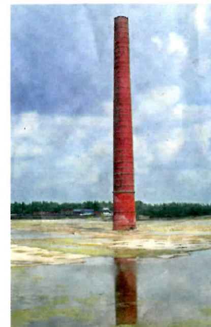
▲ De 60 meter hoge schoorsteen herinnert aan de gesloopte suikerfabriek.