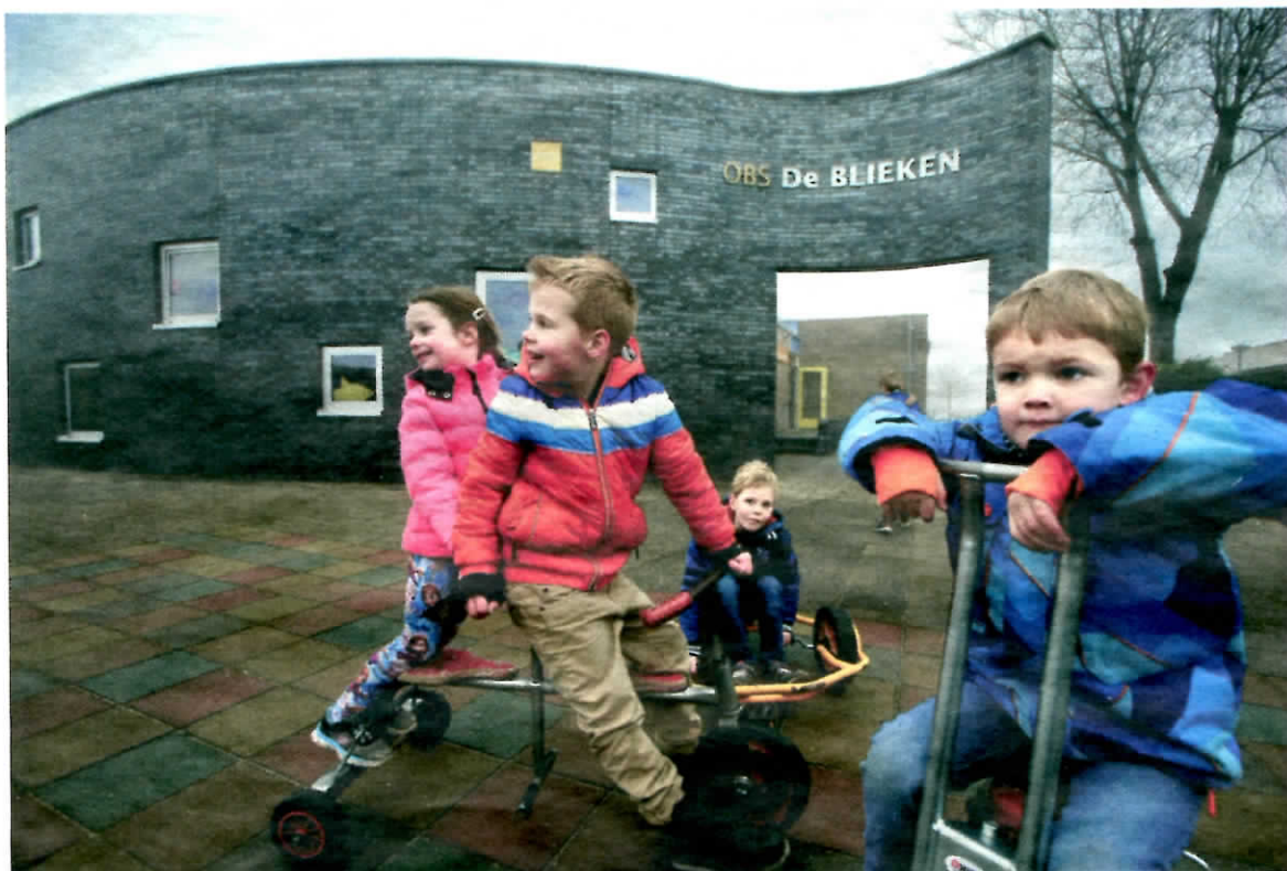
▲ Basisschool De Blieken in Klaaswaal is straks een kindcentrum met kinderopvang, peuterspeelzaal en basisschool onder één dak.