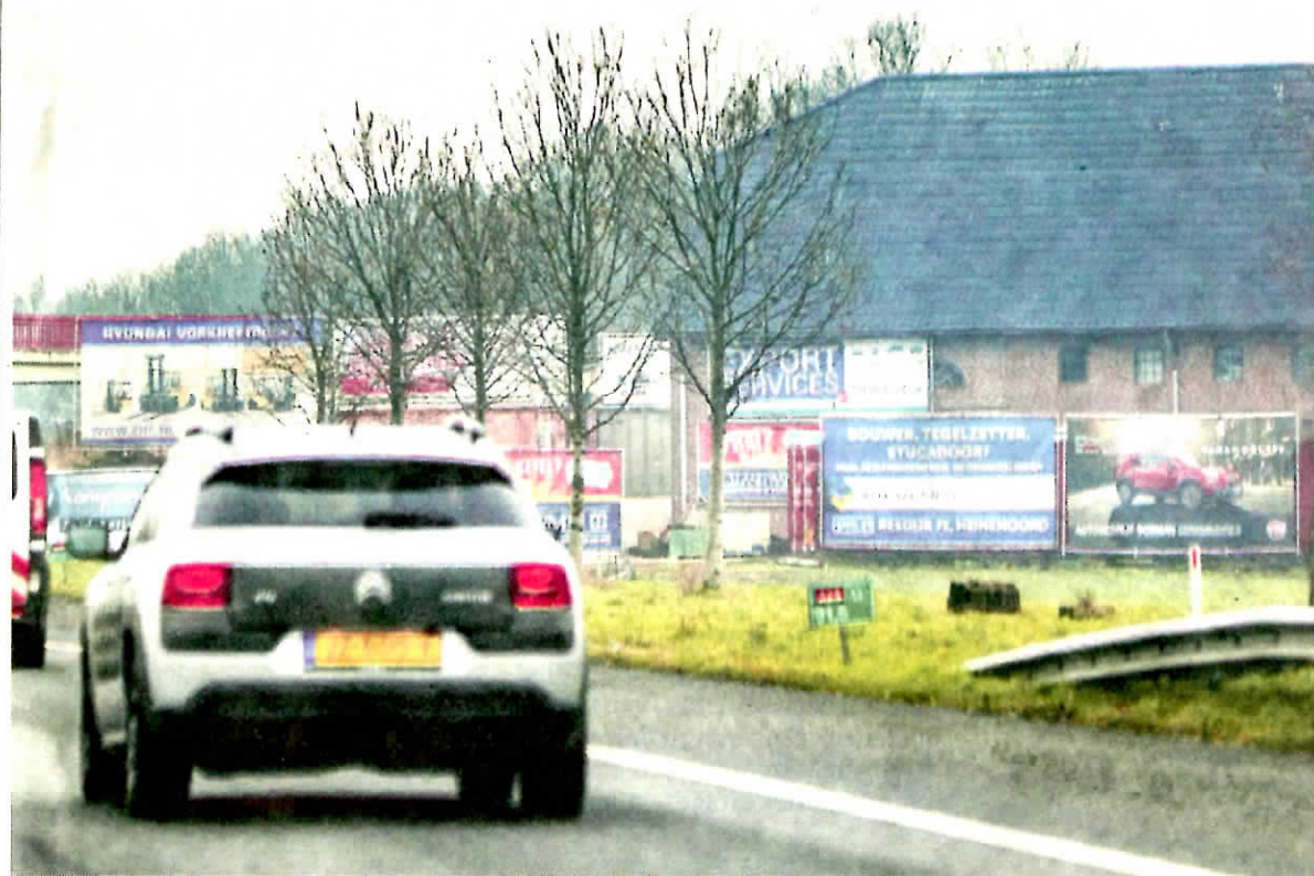
▲ Een woud van reclameborden langs de A29 bij Klaaswaal leidt tot veel ergernis.

Ter compensatie van de bomenkap gaat de gemeente naar verwachting op maandag 6 februari twaalf vervangende bomen planten. Het gaat om zes eiken en zes esdoorns.